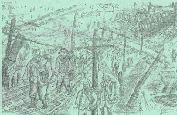
大井町線の焼け跡を歩く人々