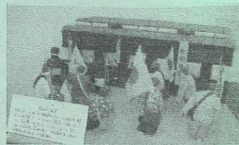
集団学童疎開を人形で

福島第一原発の事故の後、住み慣れた地を離れなければならなかった人たちの記事に「疎開」という表現がありました。少し意味は違うけれど、先の戦争の時の「学童疎開」と共通することは、いつこの状態が終わるかわからないということです。今年も、当時の子どもたちに想いを馳せてみませんか？