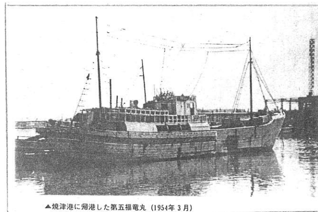
▲視津港に帰港した第五福竜丸 (1954年3月)

アメリカがマーシャル諸島ビキニ環礁で行った水爆実験で、第五福竜丸の乗組員、地元ロンゲラップ島とウトリック島の人々、当時ロンゲラップ島で気象観測をしていたアメリカ人が死の灰を浴びせられてから40年になります。彼らは、今もなお身体と心をむしばまれています。