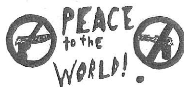
← アメリカの子どもの平和ポスター →

高校生や、大学生を対象に、平和についての意識調査を行ないました。そのまとめを展示します。