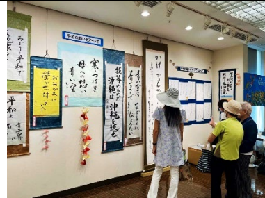
平和の願いをアートで