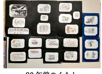
80年前の暮らし 絵：田出浩二