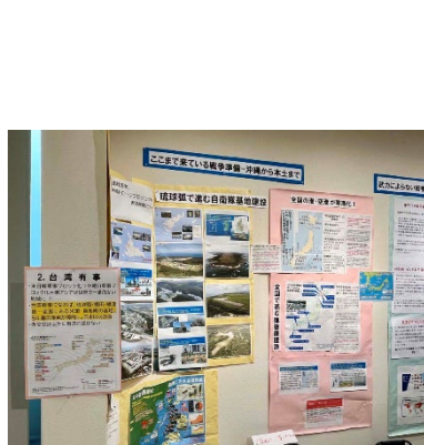
ここまで来ている戦争準備