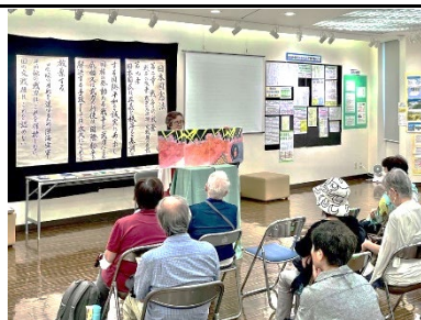
飛び出す絵本「学童疎開」