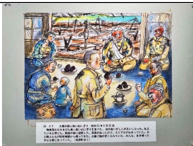
空襲後 絵：小島義一