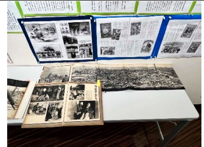
子どもたちの暮らし