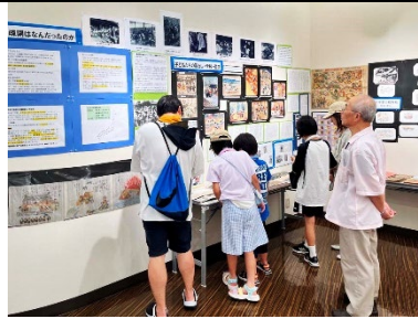
子ども達の暮らし