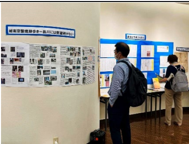
城南空襲焼け跡歩き