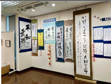
平和の願いをアートで_8月22日