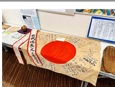
日の丸の寄せ書き