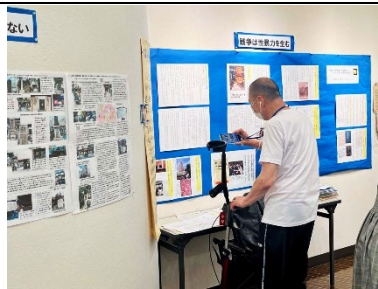
戦争は性暴力を生む