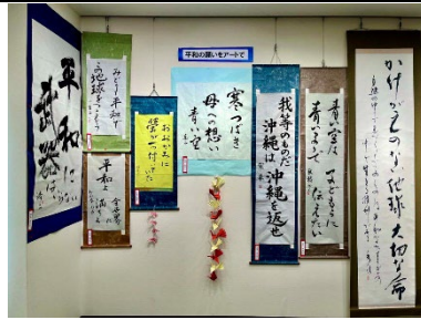
平和の願いをアートで_8月24日