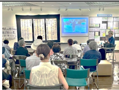
8/24 若者が見てきた沖縄