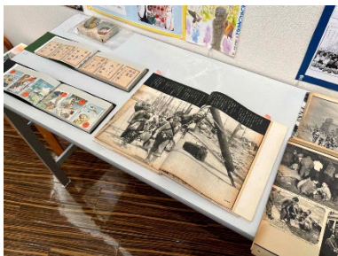
子どもたちのあそび