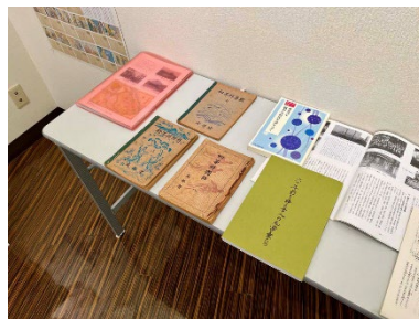
学童疎開を扱った周年誌