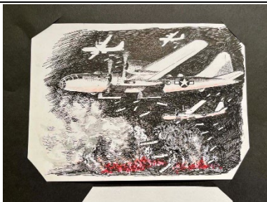
80年前の暮らし 絵：田出浩二