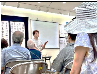
ラベリアからの引き上げ