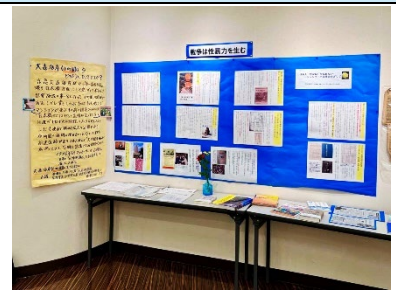
戦争は性暴力を生む_8月24日