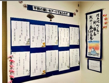
平和の願いをアートで_8月22日