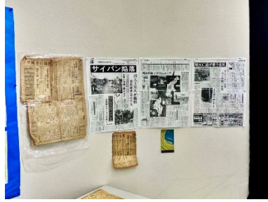
昭和16年の新聞 今新聞にするなら