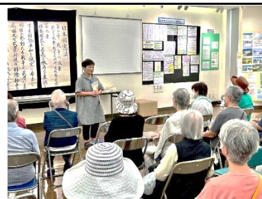
戦争の語り「ランドセル地蔵」