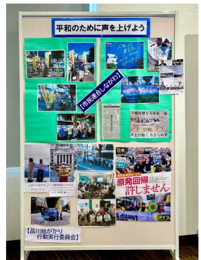
平和のために声を上げよう