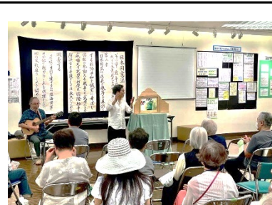
紙芝居「かのつら物語」