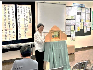
8/23 戦争に使われた「軍神の 母」