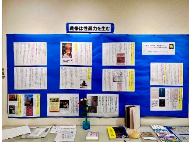
戦争は性暴力を生む_8月24日