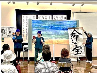
8/23 人形劇「みちくさ沖縄の人形 エイサー」