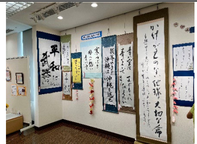
平和の願いをアートで_8月24日