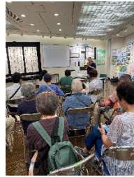
アウシュビッツ報告