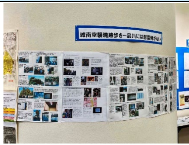
城南空襲焼跡歩き