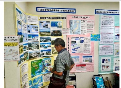
ここまで来ている戦争準備