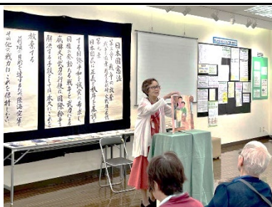
飛び出す絵本「みねおくんの夏」