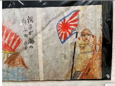
子どもたちの絵にも戦争が